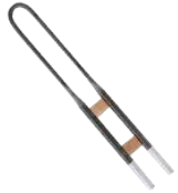
high-purity U type Molybdenum silicide rod