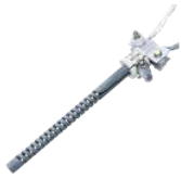
high-purity double-spiral Silicon Carbide rods