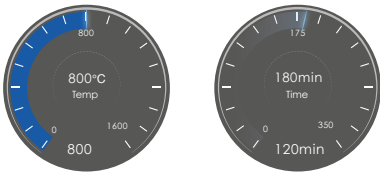
120°C per min in fast sintering